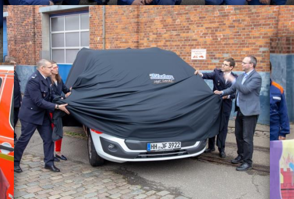
Enthüllung des Busses