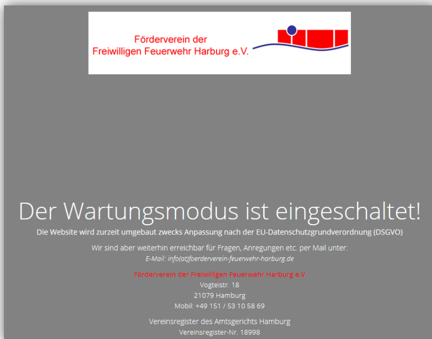
Aktuelle WEB-Seite des Vereins

Bedingt durch das Inkrafttreten der Datenschutz-Grundverordnung (DSGVO), das für alle sehr überraschen kam, mussten wir für die Präsentation des Vereins im Internet aus Sicherheitsgründen die Sofortmaßnahme der Sperrung der Seite ergreifen. Daher sieht die Seite bis auf weiteres wie rechts zu sehen aus. Zurzeit ist eine Arbeitsgruppe dabei, die im Verein gespeicherten Daten, deren Verarbeitungs- und Sicherungsverfahren zu erheben und die durch die Verordnung geforderten Dokumente zu erstellen und entsprechende Maßnahmen zu ergreifen. In der Folge werden voraussichtlich an die Vereinsmitglieder entsprechende Erklärungen zum Datenschutz verschickt und von diesen bestätigt werden müssen.